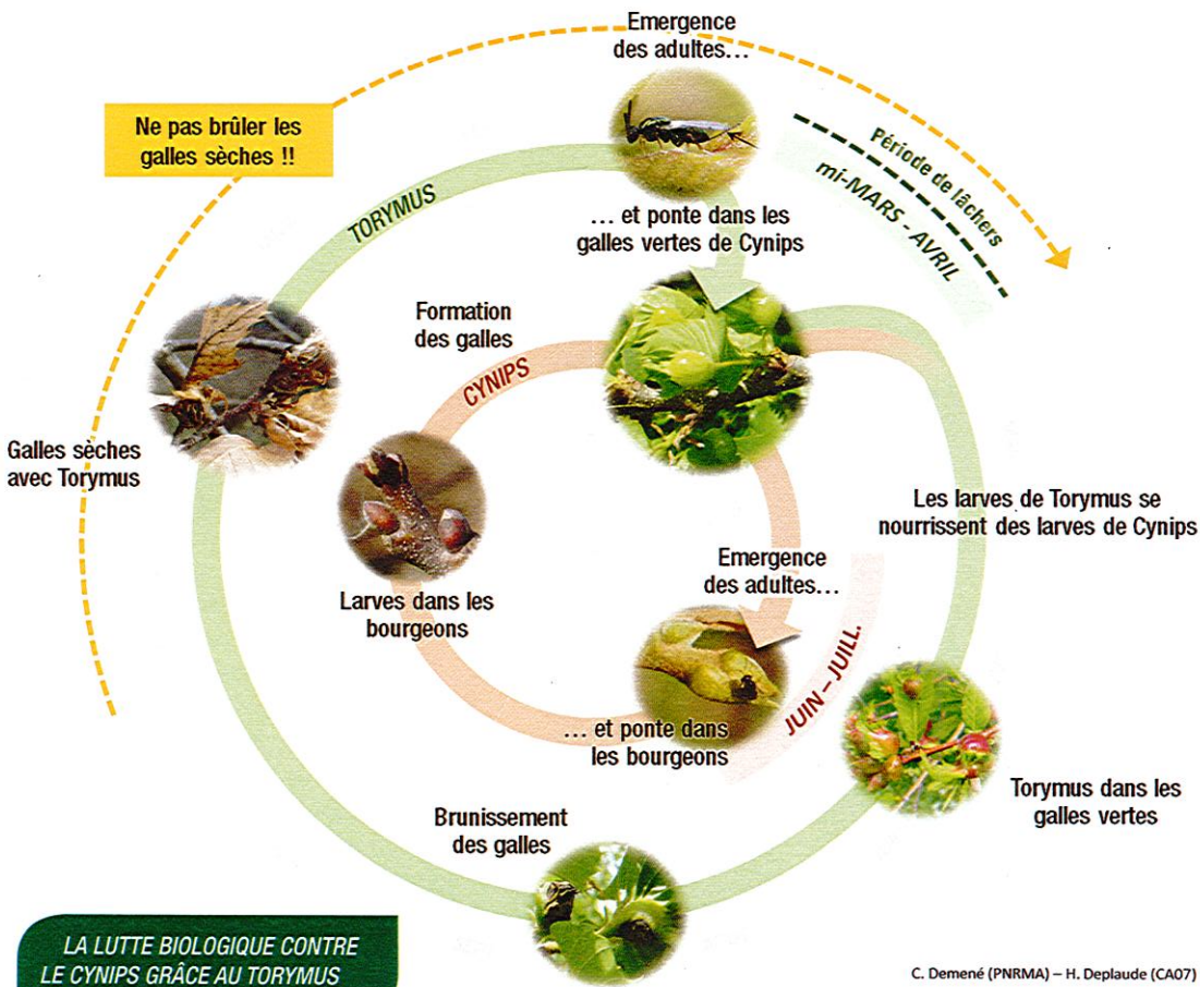
LA LUTTE BIOLOGIQUE CONTRE LE CYNIPS GRÂCE AU TORYMUS

En 2014, 90 lâchers ont été réalisés, et le Torymus est actuellement présent sur une grande partie du territoire ardéchois, en faibles quantités. Son impact sur les populations de cynips n'est pas encore observable, il va augmenter d'année en année à mesure que le Torymus se multiplie.