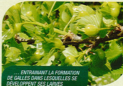
... ENTRAINANT LA FORMATION DE GALLES DANS LESQUELLES SE DÉVELOPPENT SES LARVES