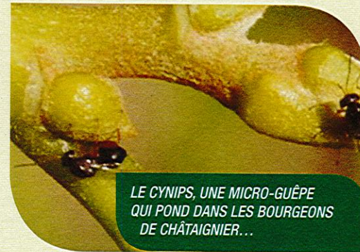
LE CYNIPS, UNE MICRO-GUÊPE QUI POND DANS LES BOURGEONS DE CHÂTAIGNIER...

Il est considéré comme le principal ravageur de la châtaigne au niveau mondial.