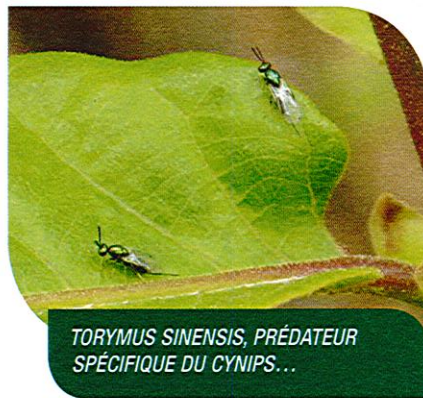
TORYMUS SINENSIS, PRÉDATEUR SPÉCIFIQUE DU CYNIPS...

Une fois lâché, le Torymus se déplace sur de grandes distances (5 à 15 km) et colonise toutes les châtaigneraies alentours, bénéficiant à tous. Le Torymus ne va pas éradiquer entièrement le cynips, il va le réguler. Un équilibre va s'établir entre le cynips et son prédateur, permettant ainsi de revenir à de bons niveaux de production de châtaigne.